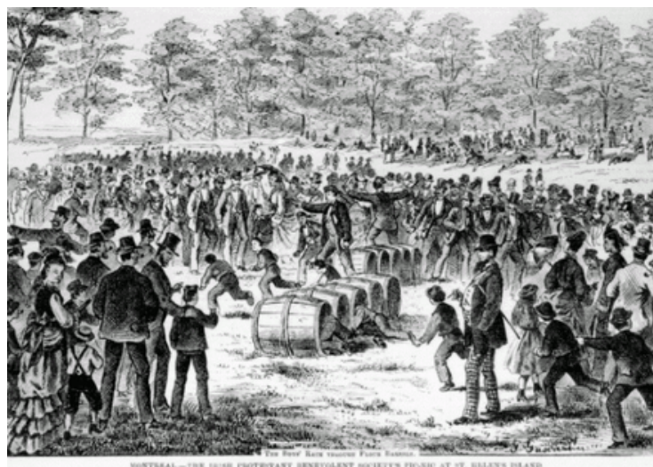
Pique-nique de la SBPI, 1874