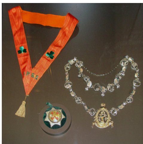
Symboles de la Société de bienfaisance protestante irlandaise de Montréal (fondée en 1856).

Inspirée notamment par l'ouvrage The Irish Way de Edgar Andrew Collard, la Société demeure une gardienne attentive de l'identité protestante irlandaise à Montréal, alliant sens des affaires et profond devoir envers la collectivité.